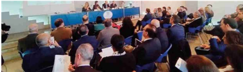
La presentazione della misura Africa nella sede di Sicindustria (as)